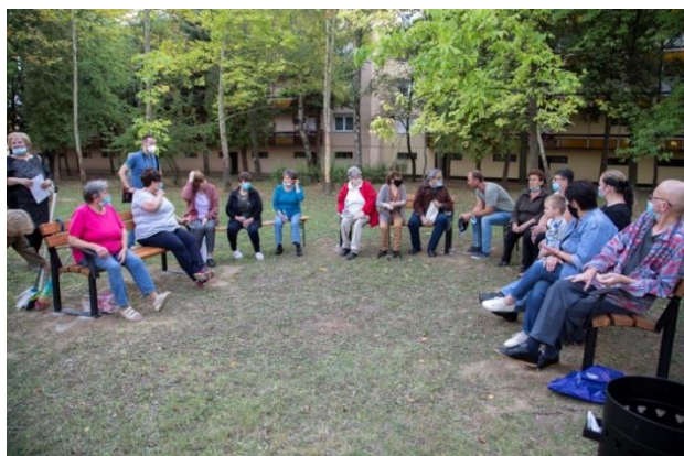
Hangulatfelelős: Kovács Gábor